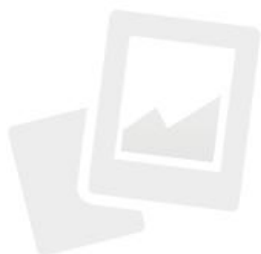
IMMAGINE NON DISPONIBILE